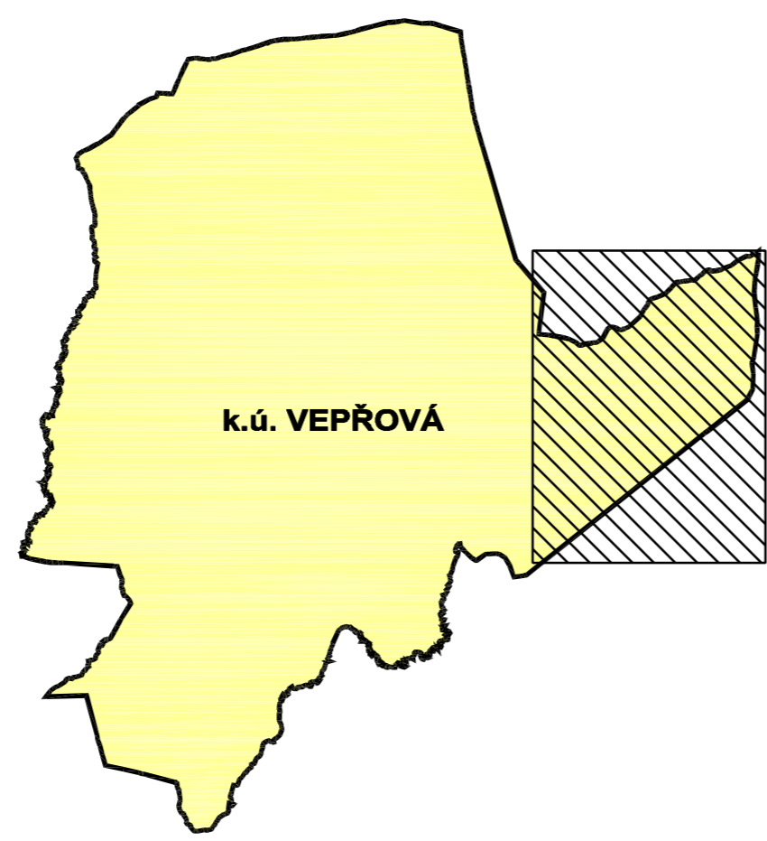
VYZNAČENÍ VÝŘEZU VE VZTAHU K ŘEŠENÉMU ÚZEMÍ